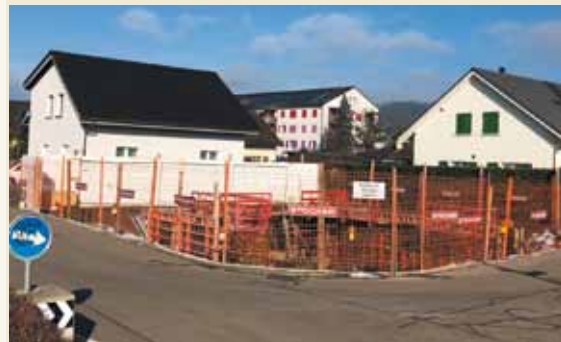
Rainstrasse