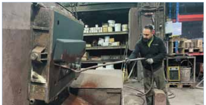
Altes Rad (oben) und Giessarbeiten neues Rad