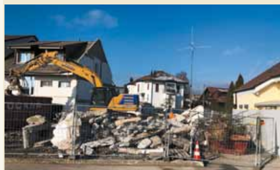
Schulhausstrasse