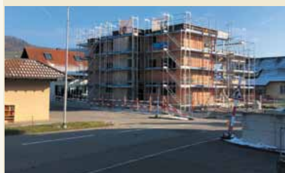
Winkelstrasse