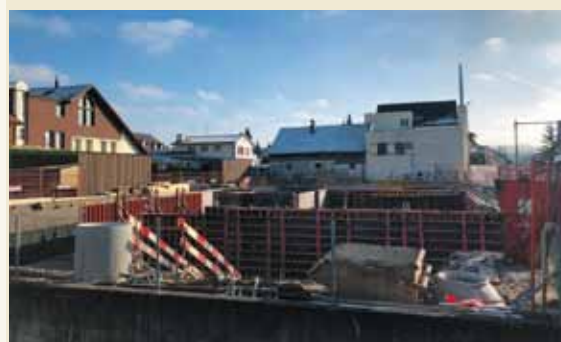
Stauseestrasse